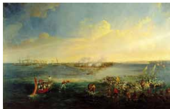
Toma de los fuertes de Balanguingui