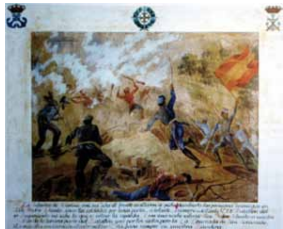
Combate de San Pedro Abanto