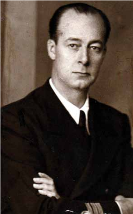
Retrato de Pérez de Guzmán

También en las campañas de Balanguingui en las Filipinas (1848), de las islas Chafarinas (1848), de Italia (1849-1850), de Joló (1851 y 1861), de Cochinchina (1859-1860); guerra de África (1859-1860, señaladamente en el bombardeo de Arcila y Tetuán); campaña del Pacífico y bombardeo del Callao (1865, allí ganó la laureada el marinero Fernando Miranda Caamaño); tercera guerra carlista (1872-1876); campaña de las Carolinas (1887); y campañas de Cuba y Filipinas. De entre todos los marinos condecorados con la cruz de San Fernando en aquellas campañas, recordaré al menos cuatro casos señeros.