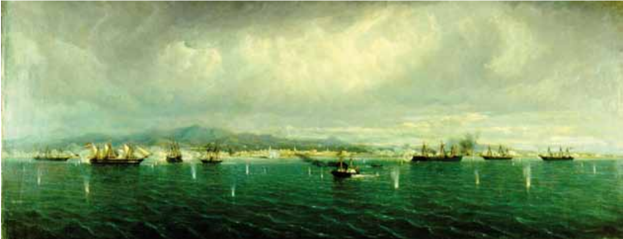
Bombardeo del Callao

que la mereció en 1834, siendo brigadier del Ejército, por un encuentro que tuvo con los carlistas en Jarque (Zaragoza), que le costó dos graves heridas.