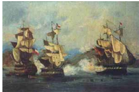
Combate de la Esmeralda