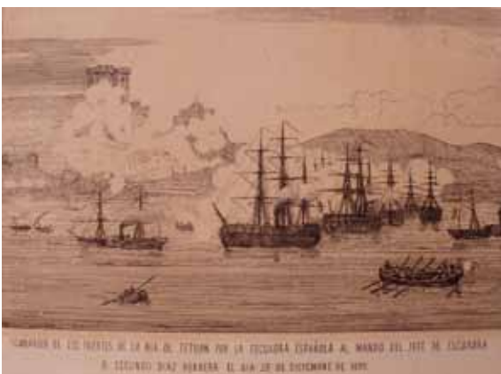
Bombardeo de Tetuán

De entre las primeras concesiones, notemos algunos hechos memorables. Por ejemplo, el 27 de abril de 1818, en aguas de Valparaíso, dos buques piratas chilenos, arbolando bandera británica, lograron acercarse a la fragata Esmeralda (del porte de 36 cañones y dotación de 250 hombres) y sorprender con un rápido abordaje a la tripulación; pero rehechos los marinos españoles en el castillo del buque, lograron