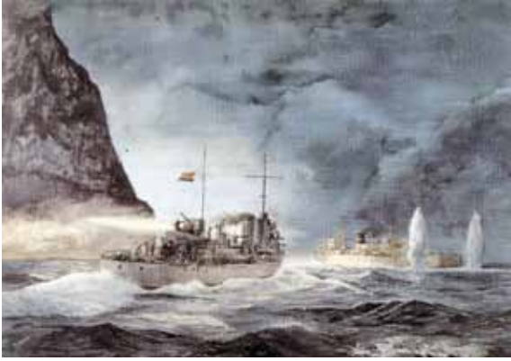
Combate del Vulcano y el José Luis Díez

A partir de los iniciales 33 personajes identificados en la lápida puesta por el vicealmirante Torres en la Escuela Naval Militar, concluidas nuestras pesquisas hemos pasado a conocer con precisión los nombres y circunstancias de nada menos que 319 marinos laureados: 12 grandes cruces laureadas; 2 cruces laureadas de cuarta clase; 37 cruces laureadas de segunda clase; 10 cruces sencillas de tercera clase; y 256 cruces sencillas de tercera clase (más dos carlistas). Y, además, otras 156 cruces dadas a personal del Ejército, paisanos y marinos extranjeros, por hechos de mar. Y, dado que el vigente Reglamento de la Orden incluye entre sus miembros a todos los condecorados con la Medalla Militar individual (que desde 1918 sustituye a las cruces sencillas de tercera y primera clase de la Orden de San Fernando), hemos formado también las relaciones de los marinos condecorados con esta preciada condecoración al valor: 32 con la Medalla Naval individual (y doce colectivas), 58 con la Medalla Militar individual (y 8 colectivas), y 4 con la Medalla Aérea individual.