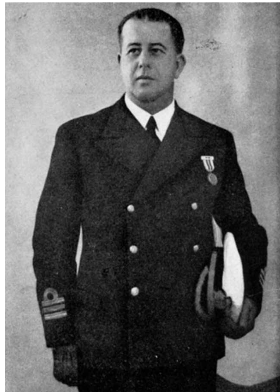
Retrato de Abarzuza